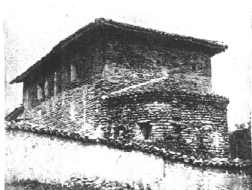
Chiesa cimiteriale di San Lorenzo