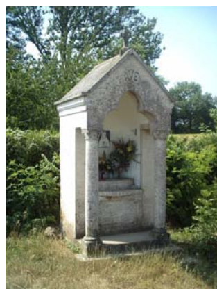
Pilone di Pralungo