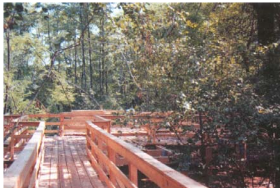
Area umida del torrente Ceronda