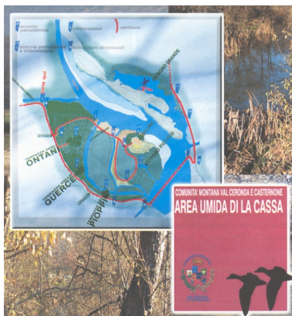
Percorso area umida